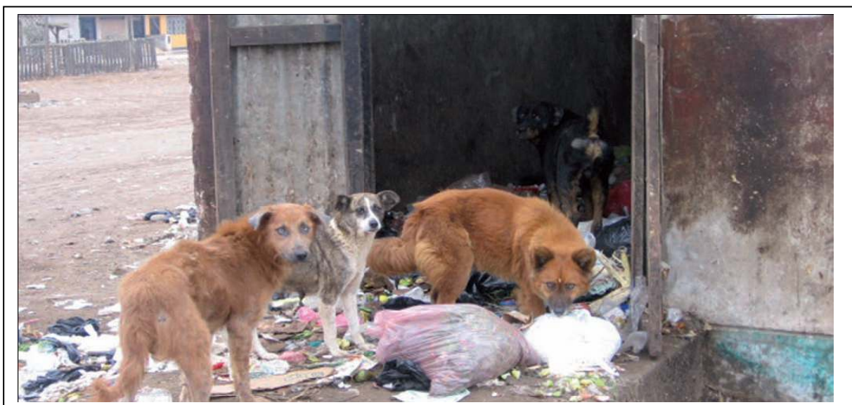
การเข้าถึงปัจจัยยังชีพโดยการคุ้ยถังขยะของสุนัข ในประเทศเปรู