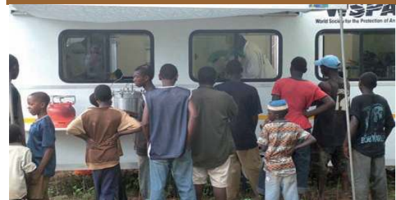
ชาวบ้านกำลังดูการผ่าตัดทำหมันทางหน้าต่างคลินิกเคลื่อนที่ในซานซิบาร์

ในปี 2549 มีเหตุการณ์ที่คล้ายคลึงกันในซานซิบาร์ เมื่อ WSPA และ รัฐบาลท้องถิ่นริเริ่มนำมาตรการแทรกแซงโดยการทำหมัน โครงการเริ่มต้นที่การได้รับความร่วมมือน้อย มีเจ้าของไม่กี่รายที่แสดงความประสงค์จะนำสัตว์มาทำหมัน อย่างไรก็ตามเวลาผ่านไปหลายเดือน การให้การศึกษาแลกเปลี่ยนความเห็นกับผู้นำชุมชนและตัวอย่างของสัตว์ที่ถูกทำหมันแต่ยังมีสุขภาพดีเริ่มสร้างความเปลี่ยนแปลงต่อทัศนคติของชาวบ้าน ชาวบ้านจึงเริ่มกระตือรือร้นนำสัตว์ของตนมาทำหมัน