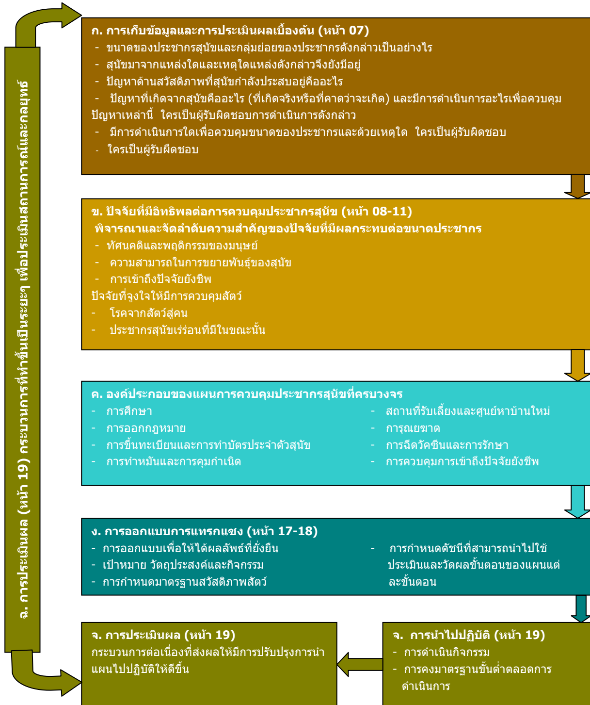
ภาพ 2 ภาพรวมกระบวนการ

คู่มือนี้มีโครงสร้างดังที่อธิบายในภาพ 2 ต่อไปนี้ : ภาพรวมกระบวนการ