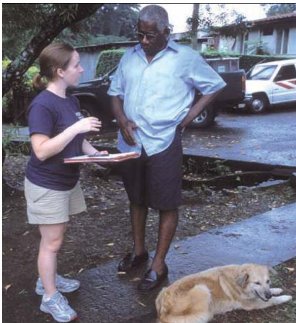
สำรวจความเห็นจากเจ้าของสุนัขในโดมินีกา

ทัศนคติและความเชื่อเบื้องหลังพฤติกรรมดังกล่าวอาจประเมินเป็นตัวเลข (ที่ใช้สเกลตัวเลขทั่วไป) ได้ยาก การพูดคุยหรือทำการสัมภาษณ์กลุ่มคนที่มีประสบการณ์เกี่ยวข้อง (เช่น เจ้าของสุนัขหรือเจ้าหน้าที่ที่ทำงานด้านสุขภาพสุนัข) แบบเปิดจะช่วยให้ได้รับความเห็น กลุ่มการพูดคุยนี้จะต้องมีขนาดเล็กและไม่เป็นทางการโดยเปิดให้มีการแสดงความเห็นในหัวข้อที่พูดคุยอย่างเสรีใช้คำถามสดเพื่อเป็นแนวทางการพูดคุย