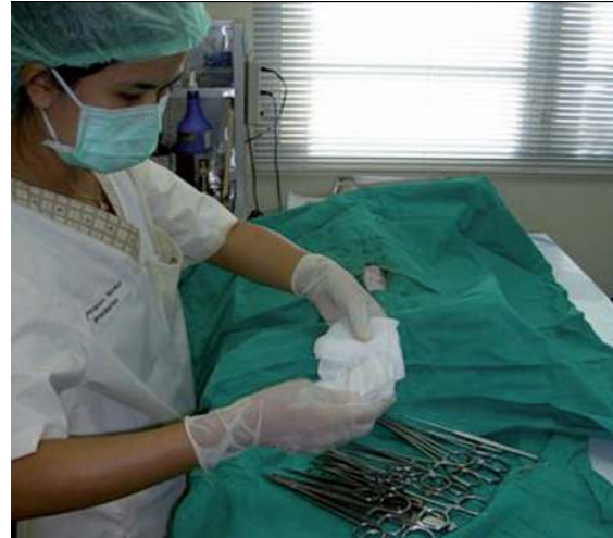
การผ่าตัดโดยใช้เทคนิคปลอดเชื้อ, ประเทศไทย

อาจอธิบายสวัสดิภาพของสัตว์ได้ ยกตัวอย่างเช่น การเกิดโรคแทรกซ้อนหลังผ่าตัดเป็นประจำ ภายในระยะเวลาหนึ่ง อาจบ่งบอกว่าจำเป็นต้องมีการอบรมเจ้าหน้าที่บางคนใหม่ หรือ เปลี่ยนวิธีการดูแลหลังการผ่าตัด