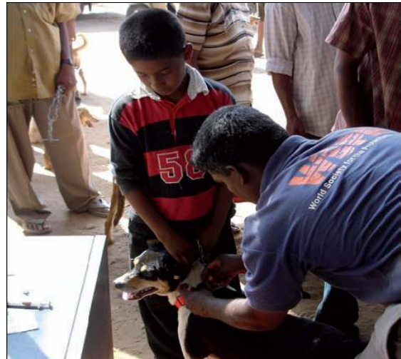
การติดปลอกคอประจำตัวสีแดงแก่สุนัขที่ได้รับวัคซีนป้องกันพิษสุนัขบ้าและ

ข. นอกจากการทำหมันและการคุมกำเนิด เรายังสามารถใช้การบำบัดเชิงป้องกันเพื่อส่งเสริมให้เจ้าของเห็นคุณค่าของการสัตวบาล และเครื่องมือควบคุมประชากรอื่น (เช่น การขึ้นทะเบียนและการทำบัตรประจำตัว) ซึ่งจำเป็นสำหรับสวัสดิภาพสัตว์ในระยะยาว ดังนั้นการค้นหาวิธีการโยกโครงสร้างพื้นฐานในพื้นที่เข้ากับการสัตวบาลเชิงป้องกันจึงเป็นประโยชน์อย่างยิ่ง การให้บริการสัตวบาลเชิงป้องกันโดยไม่เก็บค่าใช้จ่ายควรทำด้วยความระมัดระวังและสอดคล้องกับสถานการณ์ทางเศรษฐกิจของชุมชน เนื่องจากการไม่เรียกเก็บค่าใช้จ่ายหรือไม่มีการชี้แจงให้เข้าใจถึงขอบเขตการอุดหนุนเงินอาจก่อให้เกิดความเสี่ยงที่เจ้าของจะไม่เห็นคุณค่าของบริการที่ให้กับสัตว์เลี้ยง