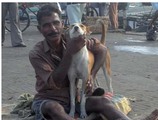
ชาวประมงและสุนัขชุมชนในประเทศอินเดีย