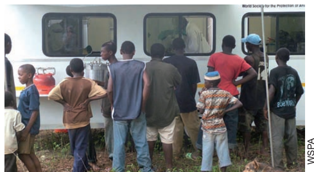
Ciudadanos locales observando los procedimientos de esterilización a través de las ventanas de una clínica móvil en Zanzíbar.

En 2006, hubo una situación similar en Zanzíbar cuando WSPA y el gobierno local introdujeron una intervención de esterilización. Empezó con poca conformidad, con pocos dueños dispuestos a llevar sus animales para un procedimiento de esterilización; sin embargo, después de un período, las actividades de educación, las discusiones con los líderes de la comunidad y los ejemplos reales de animales esterilizados saludables empezaron a crear un cambio en las actitudes humanas, llevando a las personas a buscar activamente la esterilización para sus animales.