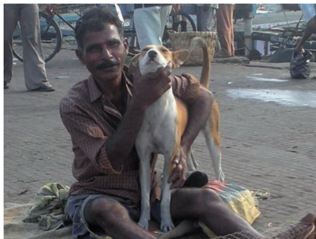
Pescador y perro de la comunidad en India.