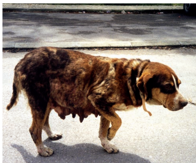
Perro callejero en Portugal.

Habrán asuntos de bienestar relacionados tanto con los perros que tienen sus movimientos restringidos como con los vagabundos/callejeros; sin embargo, para los propósitos de este documento, el objetivo del manejo de poblaciones caninas está definido así: “Manejar las poblaciones callejeras de perros y los riesgos que éstas pueden representar, incluyendo la reducción de la densidad de la población cuando se considere necesario.”