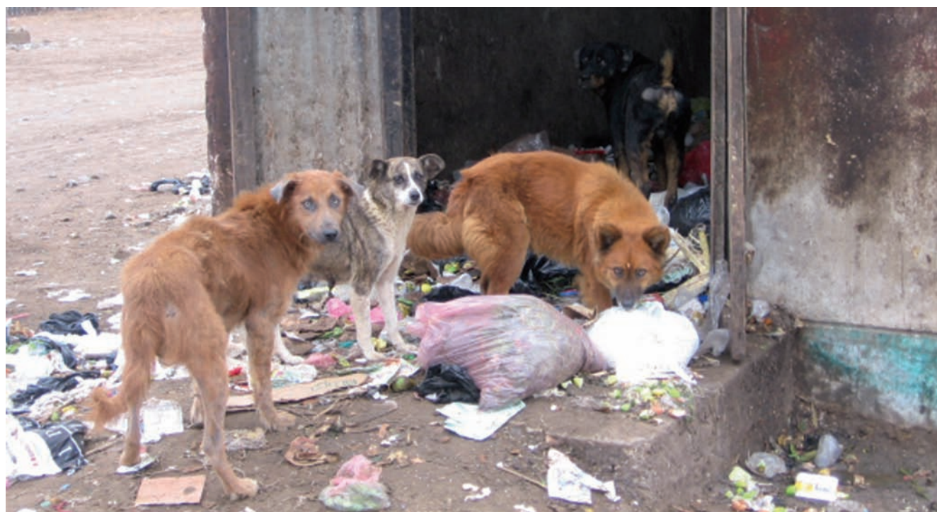
Perros callejeros en Perú alimentándose con basura.