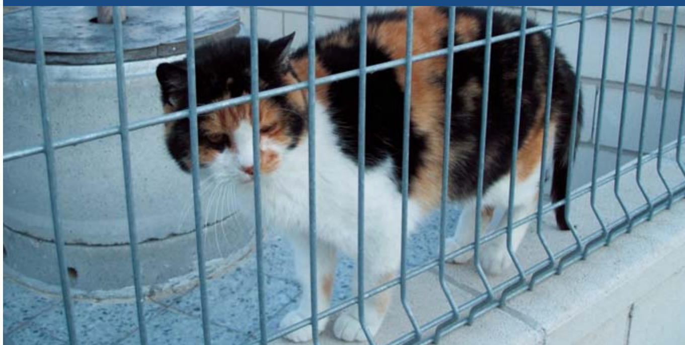
Recinto para gatos en albergue de Madrid