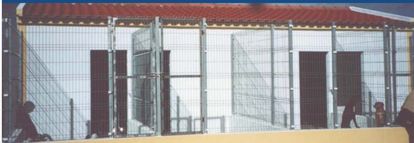
Grupo de encierros en el albergue animal de Java, Portugal

Proveer suficiente espacio, instalaciones adecuadas y la compañía de animales de su propia especie.