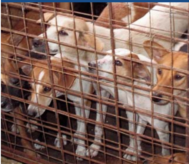
Perrera con condiciones de hacinamiento

Puede ser que, después de la evaluación, construir un albergue no sea la manera en la que a usted le será posible ayudar a la mayor cantidad de animales.