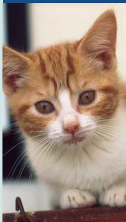
ABAJO:Gatito en el centro para animales de la RSPCA