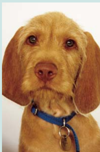
ARRIBA:Vizsla Húngaro pelo de alambre