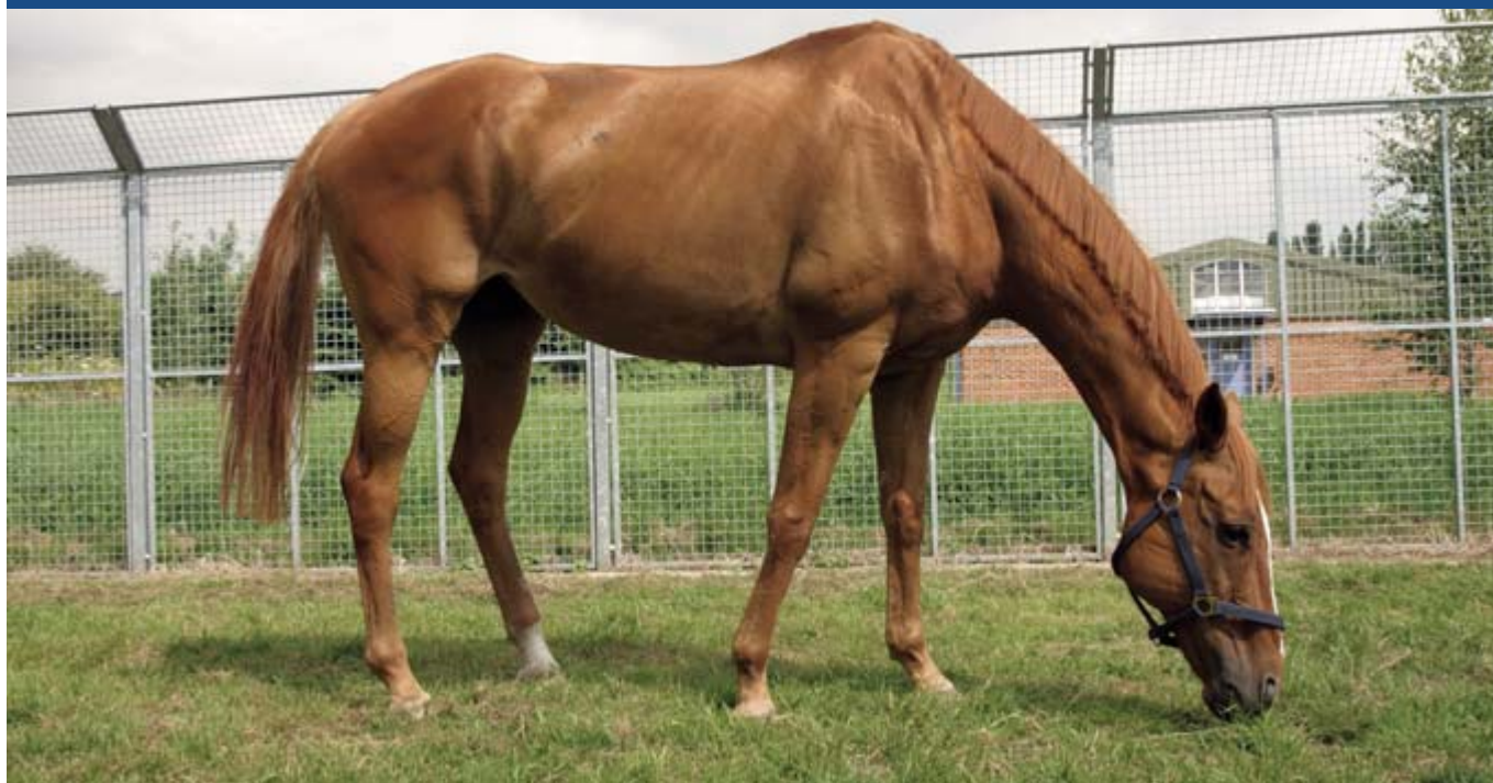
Caballo en el centro de la RSPCA

La mayoría de los albergues reciben una cantidad de animales pequeños, además de perros y gatos. Un bloque multipropósito puede ser construido, pero tenga en cuenta que como no es una unidad especializada, la estadía de estos animales debe ser tan corta como sea posible. Usted debería tratar de evitar alojar estos animales identificando a personas que estén preparadas para darles un hogar temporal hasta que sean adoptados. Las mismas condiciones de hogares temporales deberían ser adoptadas para los animales grandes. El bloque de los animales pequeños deberá ser equipado con comida y equipo apropiados, por ejemplo: jaulas.